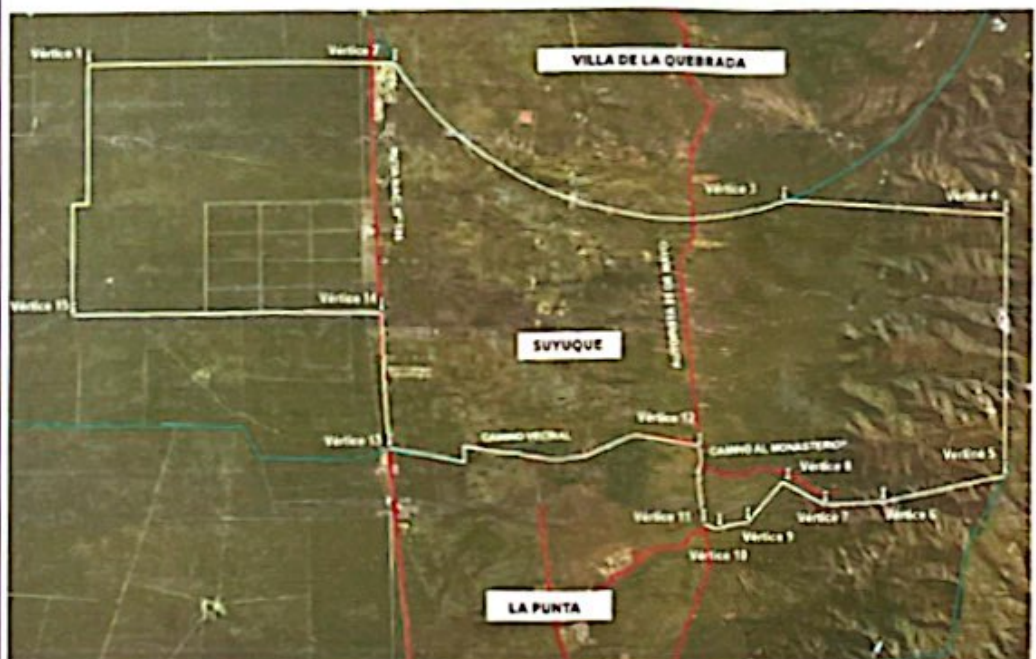
Proyección del ejido del nuevo municipio

Otro eje relevante del presente Proyecto de Ley es la necesaria reubicación del límite entre los Departamentos Juan Martín de Pueyrredón y Belgrano, ello a fin de incorporar a Suyuque Nuevo en el nuevo municipio. Cabe aclarar que solo se hace referencia a Suyuque "Nuevo" ya que la localidad conocida como Suyuque "Viejo" se encuentra situada dentro del ejido de la ciudad de La Punta.